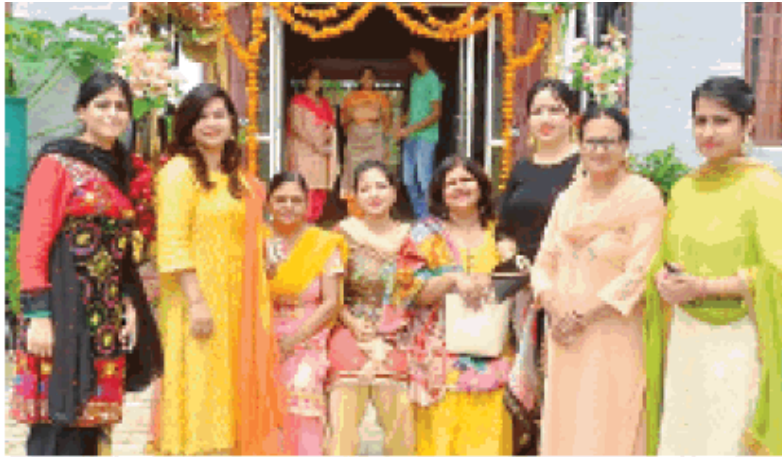
केएमएस कॉलेज दसूहा में तीज समागम के दौरान मैनेजमेंट • जागरण